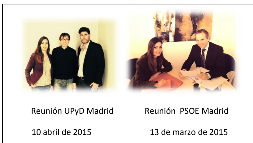
Reunión UPyD Madrid

Además, abrimos las estrategias de comunicación y diálogo con distintos representantes políticos de cara a las selecciones autonómicas y nacionales que tendrán lugar a lo largo del 2015.