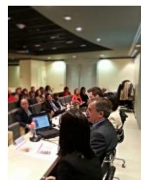
Jornada Santander- 26 Marzo 2015