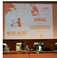
Jornada Huelva -12 Marzo 2015